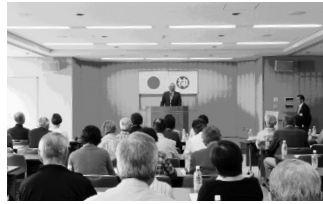
福祉推進委員研修会