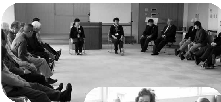
↑ 下肢筋力を鍛える体操 「椅子に座ってつま先上げ～」