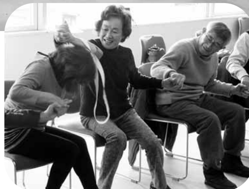
ゴムの輪くぐり→ 「手を繋いでいるので通すのが容易でないので隣の人と協力して!」