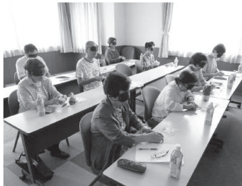
▲ 障がい者疑似体験

平成30年7月2日(月)〜25日(水)の合計7日間、神戸町社会福祉協議会において、「ちょびっとサポーター養成講座」を開催しました。 ちょびっとサポーターとは、高齢者の方にとってまなならない「ちょっとした」作業をお引き受けし、暮らしのお手伝いをするサポーターさんです。 7日間という講座にも関わらず、10名の方が受講されました。