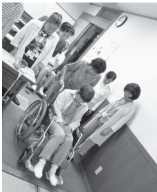
▲ 車椅子の操作方法