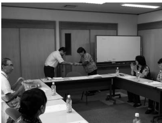
▲ 修了証交付の様子

平成30年7月2日(月)〜25日(水)の合計7日間、神戸町社会福祉協議会において、「ちょびっとサポーター養成講座」を開催しました。 ちょびっとサポーターとは、高齢者の方にとってまなならない「ちょっとした」作業をお引き受けし、暮らしのお手伝いをするサポーターさんです。 7日間という講座にも関わらず、10名の方が受講されました。