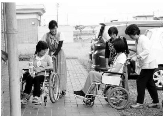
▲ 車椅子の操作方法

令和元年7月1日(月)〜26日(金)の合計7日間、神戸町社会福祉協議会において、「ちょびっとサポーター養成講座」を開催しました。 ちょびっとサポーターとは、高齢者の方にとってままならぬ「ちょっとした」作業をお引き受けし、暮らしのお手伝いをするサポーターさんです。 7日間という講座にも関わらず、6名の方が受講されました。