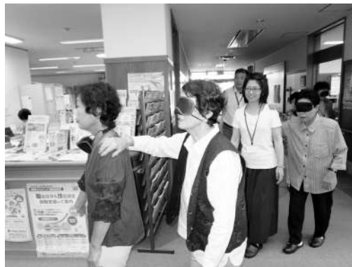
▲ 障がい者疑似体験

令和元年7月1日(月)〜26日(金)の合計7日間、神戸町社会福祉協議会において、「ちょびっとサポーター養成講座」を開催しました。 ちょびっとサポーターとは、高齢者の方にとってままならぬ「ちょっとした」作業をお引き受けし、暮らしのお手伝いをするサポーターさんです。 7日間という講座にも関わらず、6名の方が受講されました。