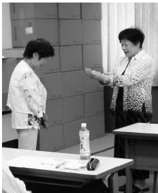
▲ 修了証交付の様子