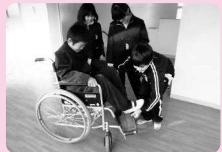
▲地域福祉学習事業

歳末たすけあい募金は、新たな年を迎える時期に支援を必要としている人々が安心して暮らすことができるようはじめた募金です。歳末たすけあい募金は、当年度のさまざまな地域福祉活動を歳末の時期に重点的に行うために使われます。