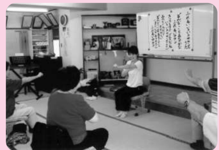
▲いきいきサロン事業