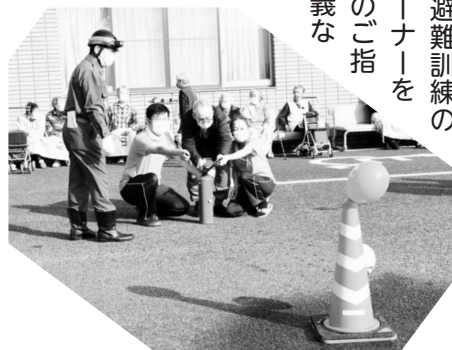
▲ 的に向かって放水!