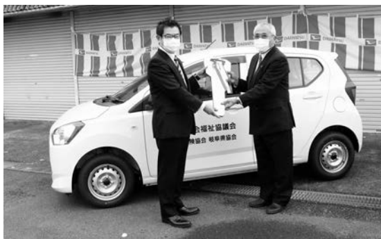
▲ この車両で皆さんの地域にお伺いします！