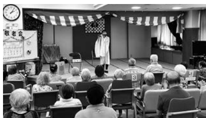
凜花のふるさと巡り 凜花様