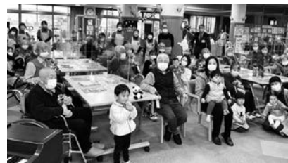
子育て支援「ほっと」様