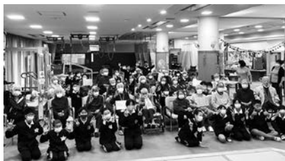
下宮小学校5年生様